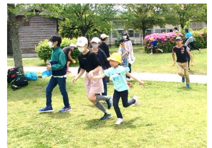
【たくさん遊んだよ】

朝早くからお弁当やお茶の準備をしていただき、子どもたちを送り出してくださった保護者の皆様のご協力に感謝いたします。ありがとうございました。