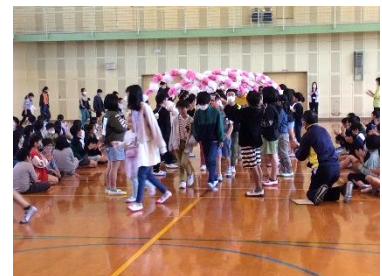
【6年生と一緒に入場!】