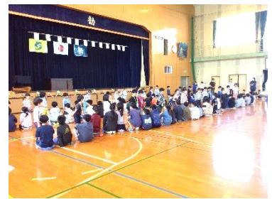
【1年生からのお礼の言葉】

集会の後、本庄公園まで「春の遠足」に出かけました。天気予報以上の晴天に恵まれ、初夏の熱気を感じながらの行程となりましたが、道行く車やお店の看板、道路の脇の草花や水路の中の生き物など、いろいろなものを見つけては会話を楽しんで、元気に歩いて行きました。