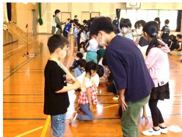
【6年生からのプレゼント】