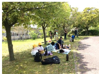
【おいしいお弁当、いただきます】