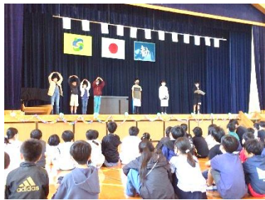
【集会委員会によるクイズ】